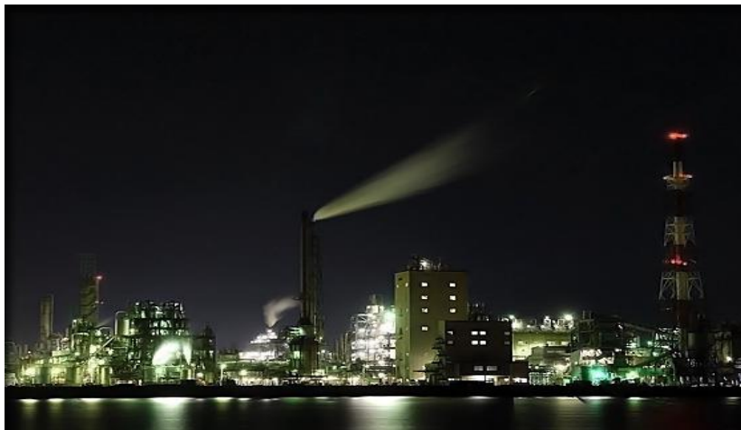
周南市コンビナート夜景

周南市は山口県下で一番の工業都市であり、また商業都市でもあります。日本でも有名な石油化学コンビナート（出光興産株式会社、株式会社トクヤマ、東ソー株式会社、日本ゼオン株式会社 等）が連なり、町も活気にあふれています。これらの会社の年商は数兆円に達し、西日本一です。その為、周南市の飲食などのサービス産業は発達しており、 学校では留学生に十分なアルバイト情報を提供することができます。