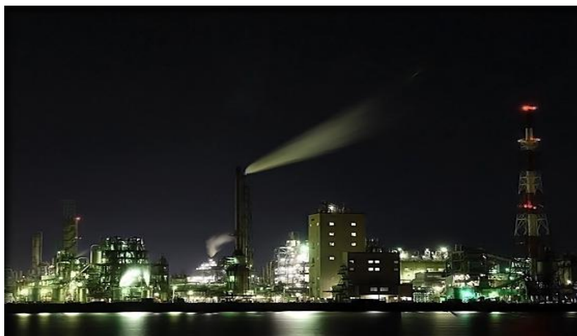
周南市コンビナート夜景

周南市は山口県下で一番の工業都市であり、また商業都市でもあります。日本でも有名な石油化学コンビナート（出光興産株式会社、株式会社トクヤマ、東ソー株式会社、日本ゼオン株式会社 等）が連なり、町も活気にあふれています。これらの会社の年商は数兆円に達し、西日本一です。その為、周南市の飲食などのサービス産業は発達しており、 学校では留学生に十分なアルバイト情報を提供することができます。