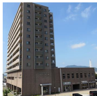
下松市駅南市民交流センター きらぼし館(HPより)